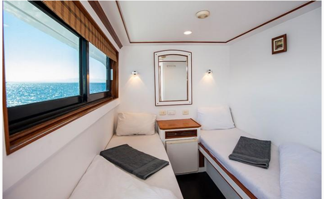
Figur 3 Dubbelhytt

MV Nouran erbjuder Nitrox. Det finns också möjlighet att hyra dubbelflaskor, tec utrustning och scooter ombord för ett tillägg. För priser onboard se https://www.redseaexplorers.com/onboard-pricing/