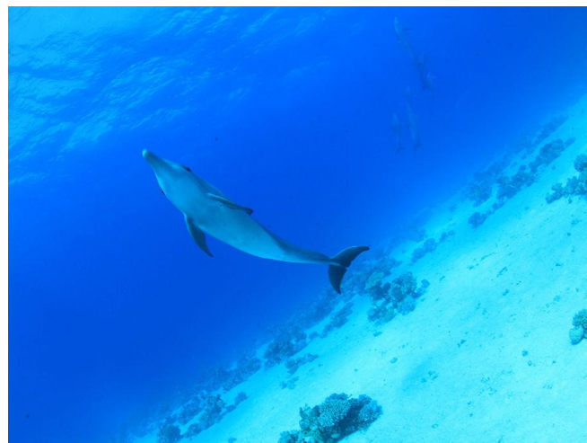
Figur 4Dolphin House

Frågor ? Ring eller mejla 08-6560303 info@ecodive.se